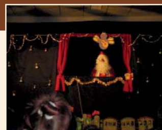
Spectacle de Noël présenté par l'association « Livres en scènes »