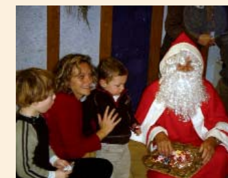
Les petits galopins à la rencontre du Père Noël.

En cette fin d'année, 90 enfants fréquentent plus ou moins régulièrement la structure ; l'agrément est toujours de 40 places.