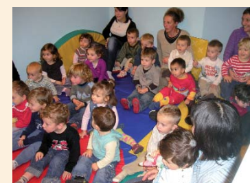
Les enfants de la crèche « Les Péquelous » attentifs devant le spectacle