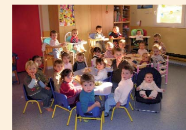
Goûter de Noël pour les p'tits Péquelous

En cette fin d'année, 80 enfants fréquentent plus ou moins régulièrement la crèche ; l'agrément reste toujours de 30 places.