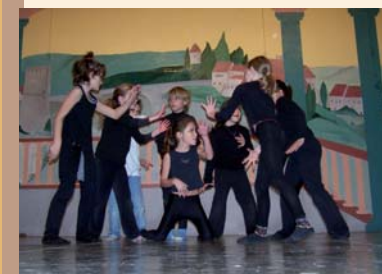
L'équipe vallonnaise au téléthon de Ruoms

Début décembre, les enfants des ateliers danse du centre de loisirs ont pu présenter un morceau de leur spectacle en préparation. Ainsi, une quarantaine d'enfants s'est produit à St Alban-Auriolles et Ruoms. Le 12 décembre, une trentaine d'enfants ont participé au jeu de piste des chevaliers leur permettant de découvrir un des villages du territoire. Ce trimestre, c'est St Alban-Auriolles qui avaient été choisi pour son dolmen et son château, les deux prochains trimestres, les enfants se rendront respectivement à Rochecolombe puis à Salavas pour découvrir ces villages à travers de nouvelles aventures.