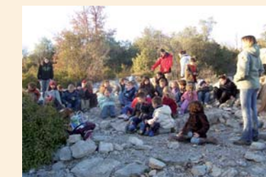
Pause goûter au dolmen de St Alban-Auriolles