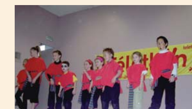
Les enfants du centre de loisirs au Téléthon de St Alban-Auriolles

Enfin, le 19 décembre, les enfants du mercredi avaient préparé le repas pour leurs animateurs, les élus et l'équipe du Viel Audon qui les accueille tout au long de l'année pour des animations. Ainsi, 58 personnes se sont retrouvées pour manger et nos petits cuisiniers en herbe se sont si bien débrouillés que c'est promis l'an prochain, ils se remettront au fourneau. Au cours de cette journée, les enfants ont aussi pu découvrir le site du Viel Audon au travers d'un grand jeu organisé par les animatrices.