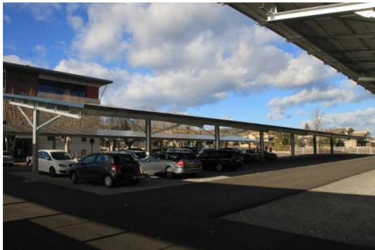
Parking gare routière

Sur le site du Pont d'Arc, les parkings Méandre et Belvédère du Pont d'Arc sont payants sur la même période, mais attention les places sont limitées.